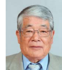
諏訪圏工業メッセ2022 実行委員会 実行委員長 茅野商工会議所 会頭